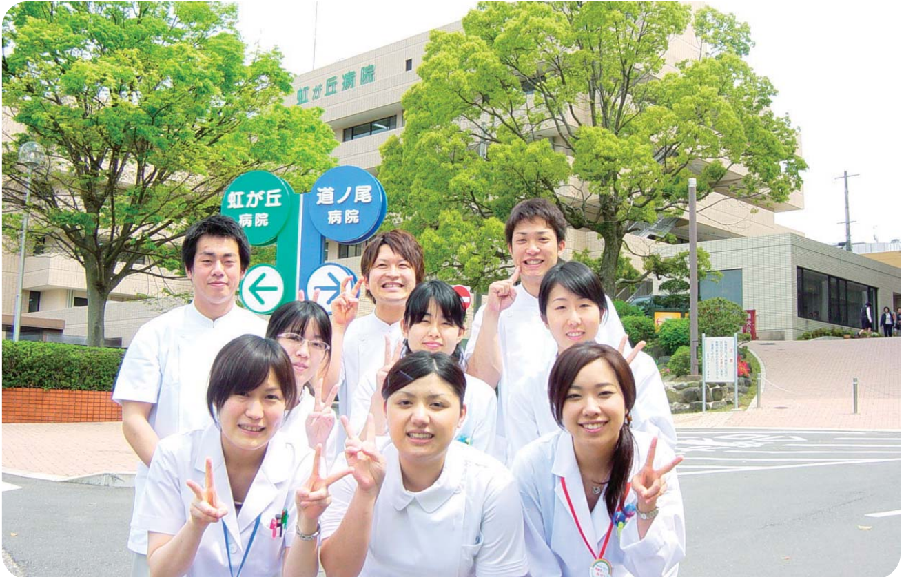
新緑に負けない新入職員のさわやかな笑顔!!