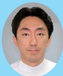
副院長（消化器外科）

当院外科では、得意とする専門分野をさらに発展させ、また増改築により施設を充実させることにより、大病院の外科とは一味ちがった特色をもつ診療科として、地域医療に貢献していきたいと思っております。